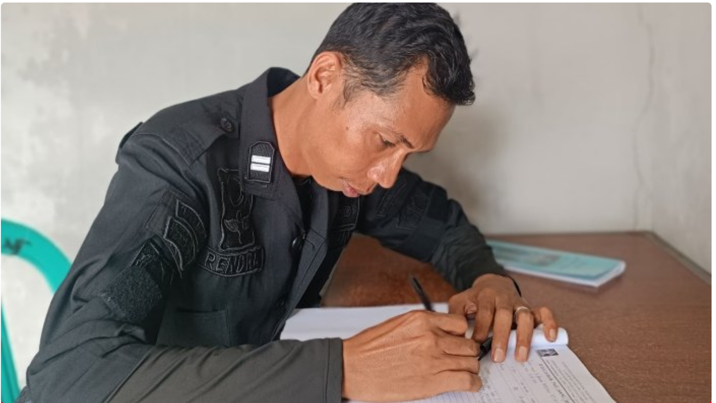
Petugas Jaga Lapas Kembangkuning Wajib Mengisi Buku Laporan Atensi Kegiatan